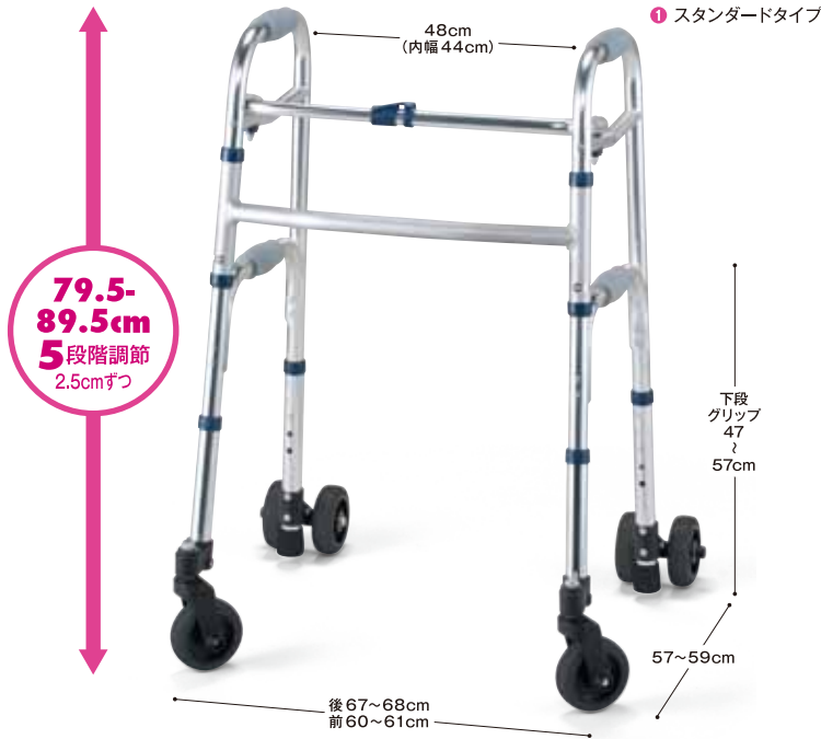
① スタンダードタイプ

4インチのワイド幅ゴムキャスターの6輪タイプ。 安定性の高いツインゴムキャスター付きストッパーを使用。