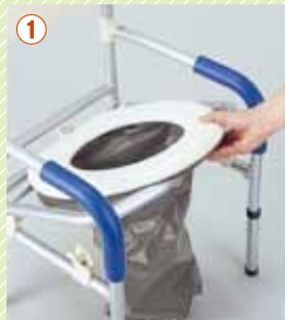
① トイレフレームに便座をセットします。