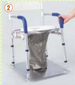
② トイレ本体を床プレートに差し込みます。