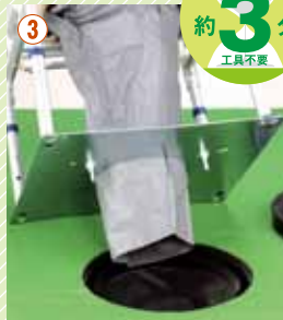
③ マンホールの上に本体を置き、固定します。