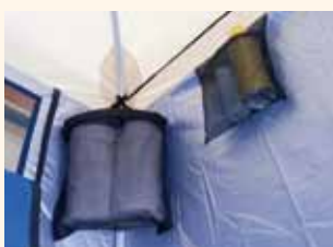
予備ペーパー、小物収納例

付属のネットに予備のペーパーを4巻き入れて、テント内に保管できます。また、消毒液などちょっとしたものを入れるメッシュの小物入れと、タオルなど軽めのものを掛けるハンガーロープが左右に各1ヶ所あります。