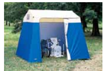
全開放・半開放参考使用例