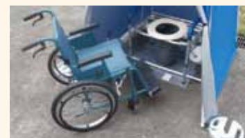
車いす進入イメージ

* テントは突然の風などで動かないように、地面にペグを打ち込むか、重石等で必ず固定をしてください。