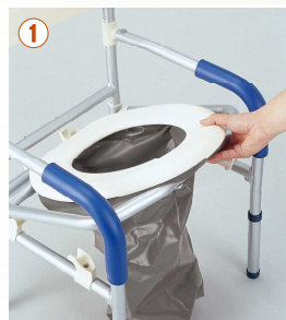
① トイレフレームに便座をセットします。