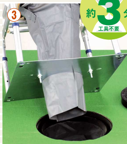
③ マンホールの上に本体を置き、固定します。