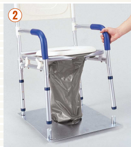
② トイレ本体を床プレートに差し込みます。