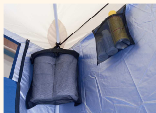
予備ペーパー、小物収納例