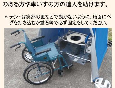
車いす進入イメージ

* テントは突然の風などで動かないように、地面にペ グを打ち込むか重石等で必ず固定してください。