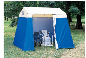
全開放・半開放参考使用例